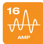
Liga-se a qualquer unidade ou estação de carregamento de 16A (3 fases) com uma ligação de tipo 2.